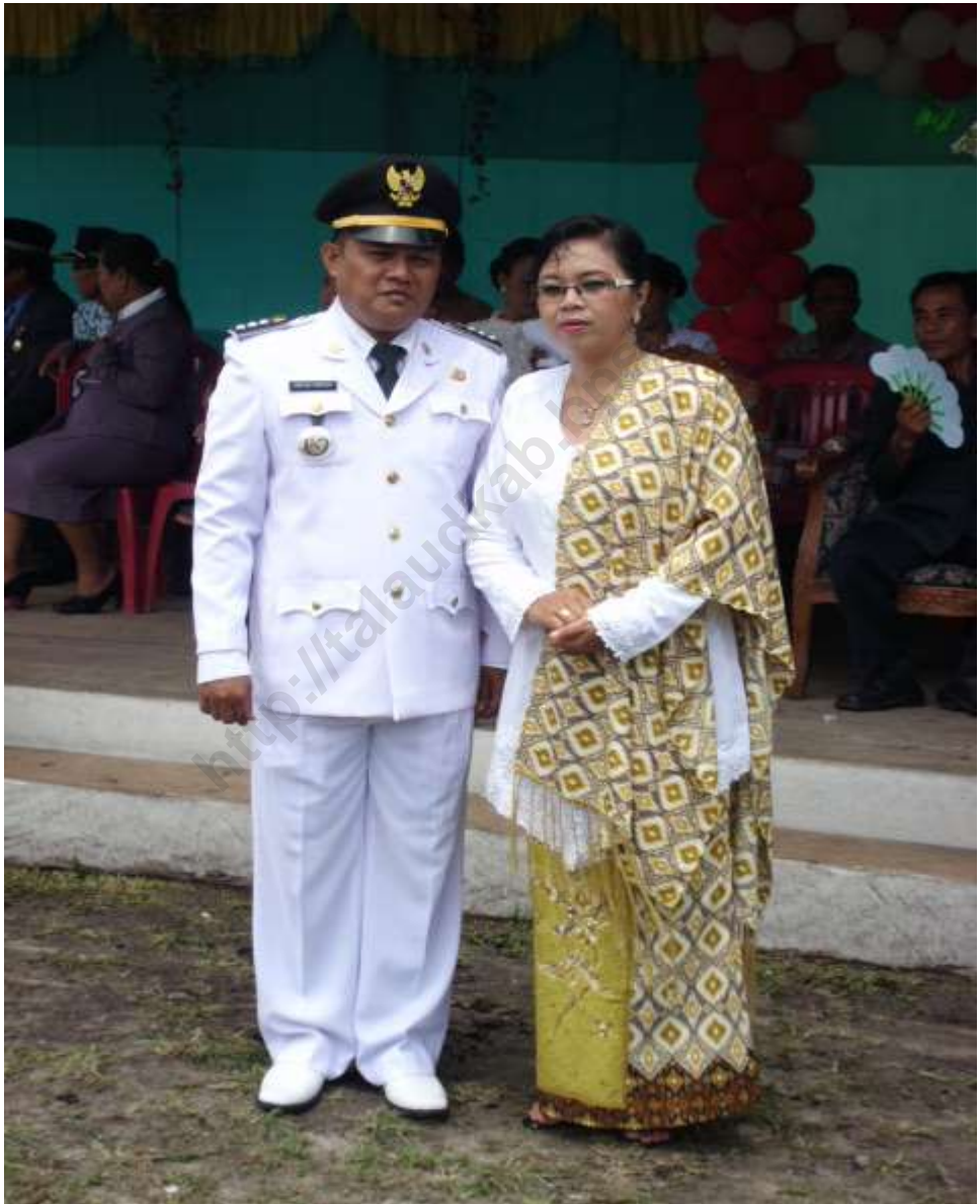
CAMAT BEO UTARA