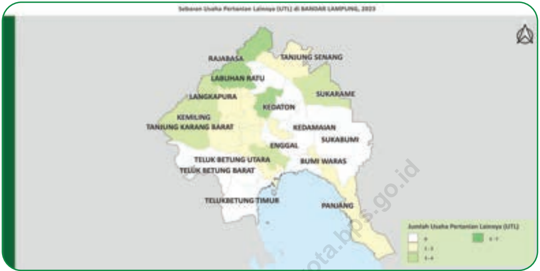
Gambar 2.3 Figures