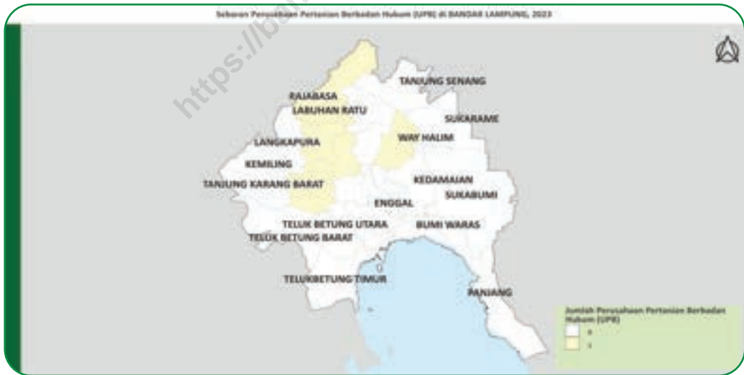
Gambar 2.2 Sebaran Perusahaan Pertanian Berbadan Hukum (UPB) di Kota Bandar Lampung, 2023 Figures Distribution of Agricultural Corporation in Bandar Lampung Municipality, 2023