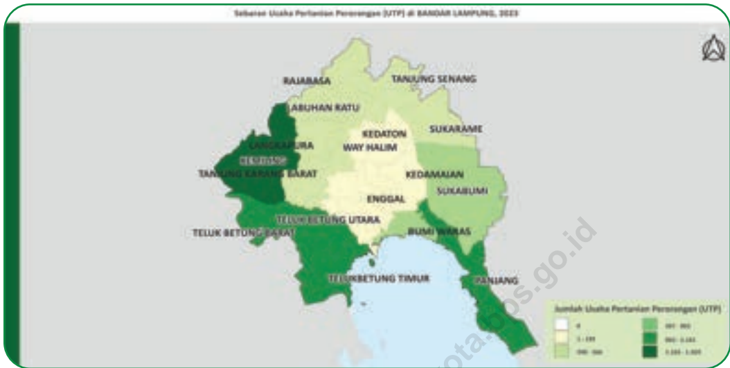
Gambar 2.1 Sebaran Usaha Pertanian Perorangan (UTP) di Kota Bandar Lampung, 2023 Figures Distribution of Individual Agricultural Holding in Bandar Lampung Municipality, 2023