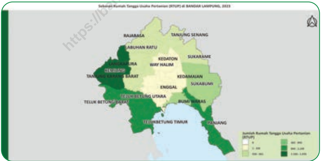
Gambar 2.4 Figures