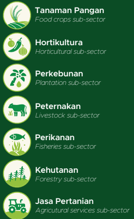
Gambar 1.1 Figures

The Coverage of Agricultural Sub-Sectors in the 2023 Census of Agriculture