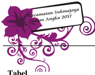
Tabel Table 9.2