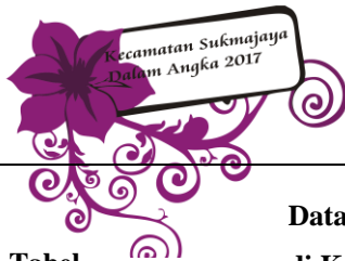
Tabel Table 9.8