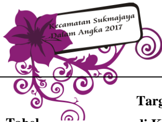
Tabel Table 10.2