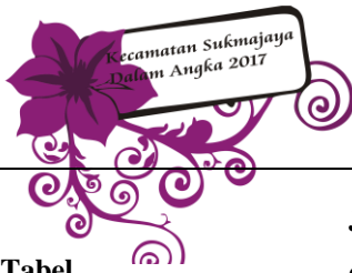
Tabel 4.1 Table