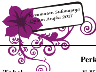
Tabel Table 10.1