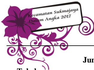
Tabel Table 3.3