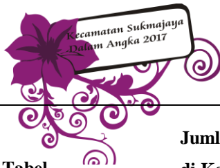
Tabel 9.7 Table