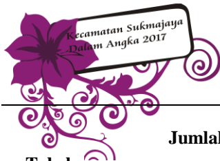
Tabel Table 2.1