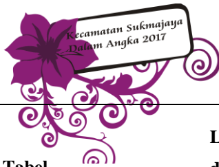
Tabel 8.1 Table