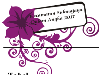
Tabel Table 5.4