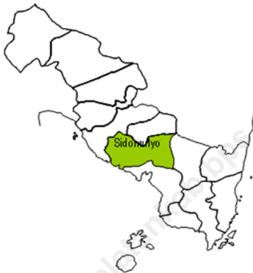
Tabel 1.1. Letak Kecamatan Sidomulyo menurut Batas Wilayah Tahun 2010