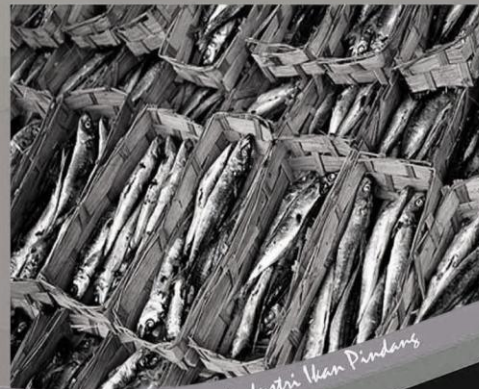
Industri Kean Pindang