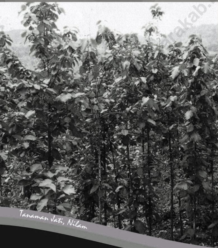
Tanaman Jati, Nilam