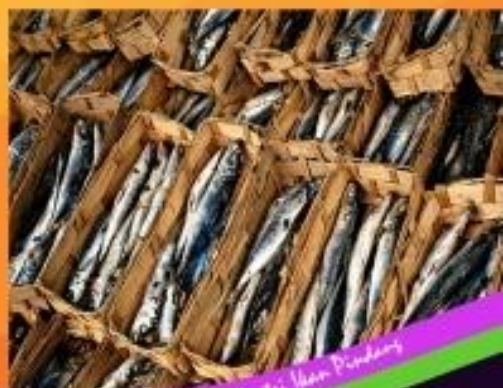
Industri Ikan Pindang