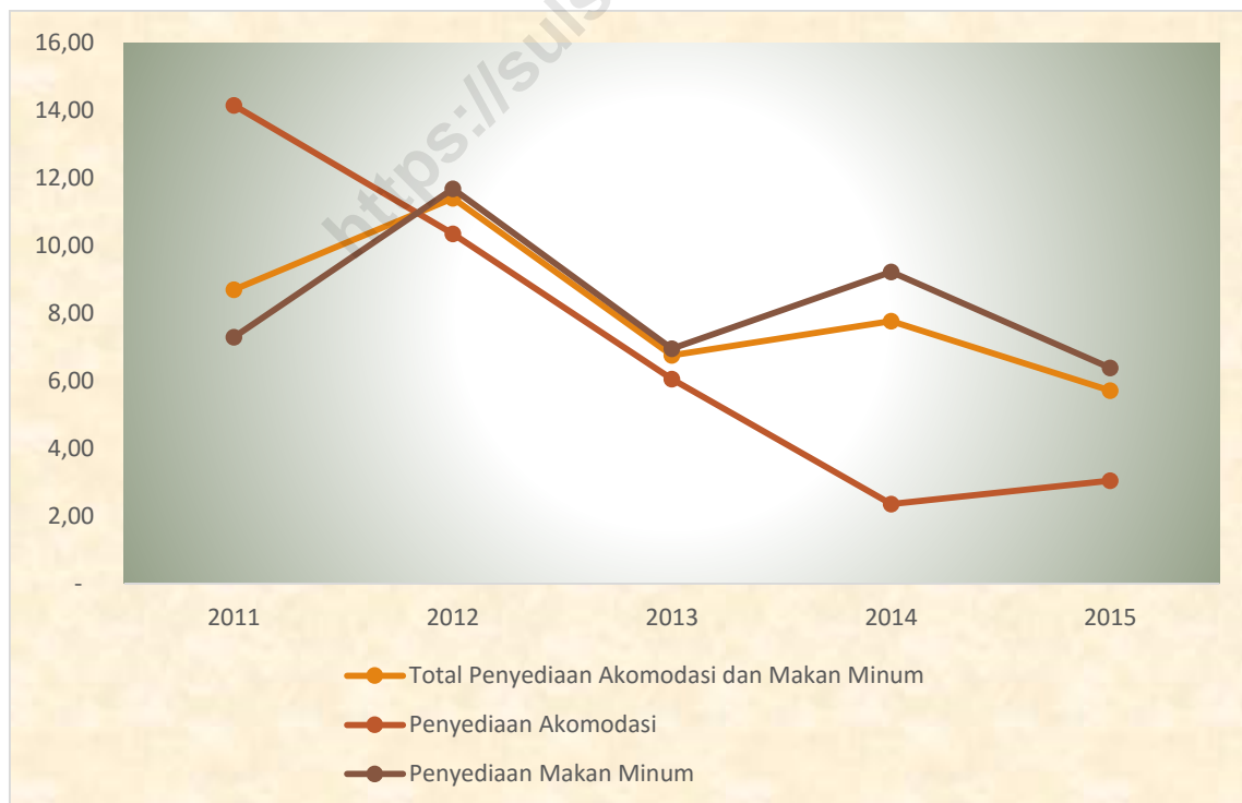
Gambar 4.2 Laju Pertumbuhan PDRB Kategori Penyediaan Akomodasi dan Makan Minum (Persen), 2011- 2015 Figure 4.2 Growth Rate of Accommodation and Food Service Activities by Industry (Percent), 2011- 2015