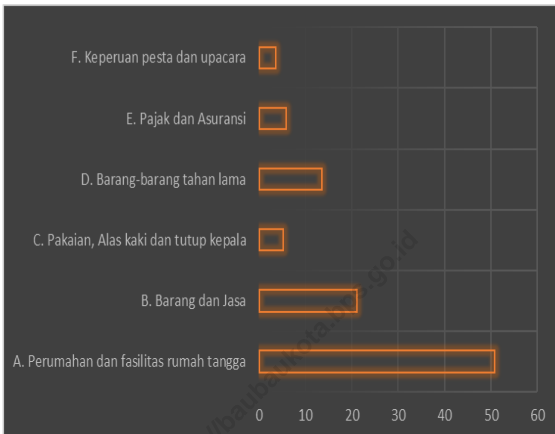
Grafik 3. Proporsi Pengeluaran Non Makanan per Kapita Sebulan menurut Kelompok Barang di Kota Baubau Tahun 2019