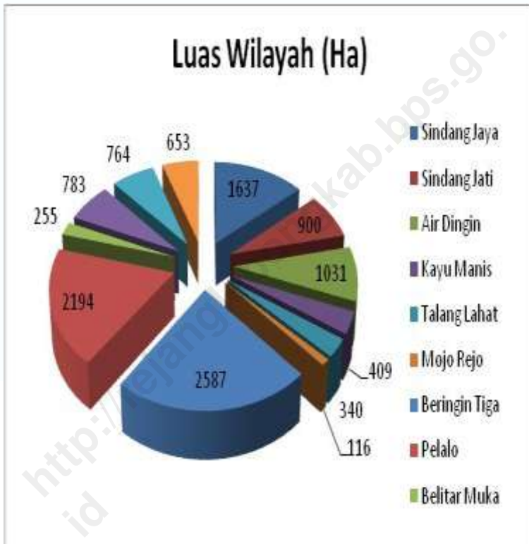
GRAFIK 1.1.2 : LUAS WILAYAH KECAMATAN MENURUT DESA DI KECAMATAN SINDANG KELINGI 2009