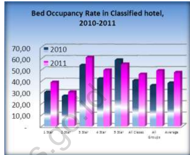
Tabel 2 / Table 2.

Persentase Tingkat Penghunian Kamar dan Tingkat Penghunian Tempat Tidur Pada Hotel dan Akomodasi Lainnya di Sumatera Utara Tahun 2011 Percentage Room Occupancy Rate and Bed Occupancy Rate Hotel has Star and Non Star / Other Accomodation In Sumatera Utara, 2011.