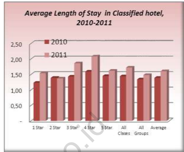
Tabel 3 / Table 3.

Rata-Rata Lama Menginap (Hari) Tamu Hotel Berbintang Dan Non Bintang / Akomodasi Lainnya Di Sumatera Utara/ Average Length of Stay (Day) Guest Hotel has Star And Non Star / Other Accomodation in Sumatera Utara 2011