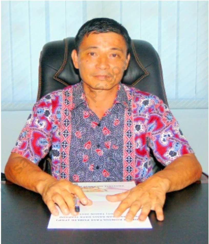
LEOPOLD RICHARD RAWUNG, SE KEPALA BPS KAB KEPL SANGIHE