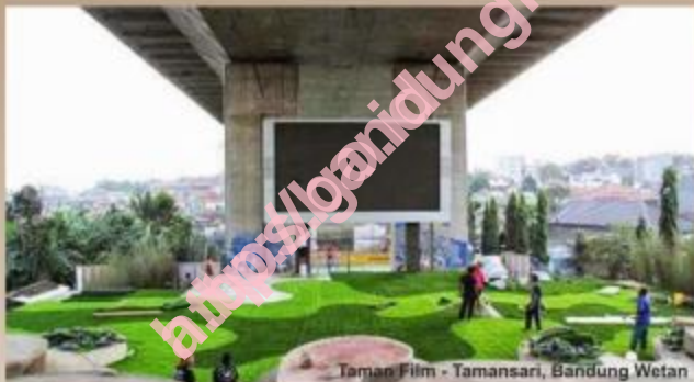
Taman Film - Tamansari, Bandung Wetan