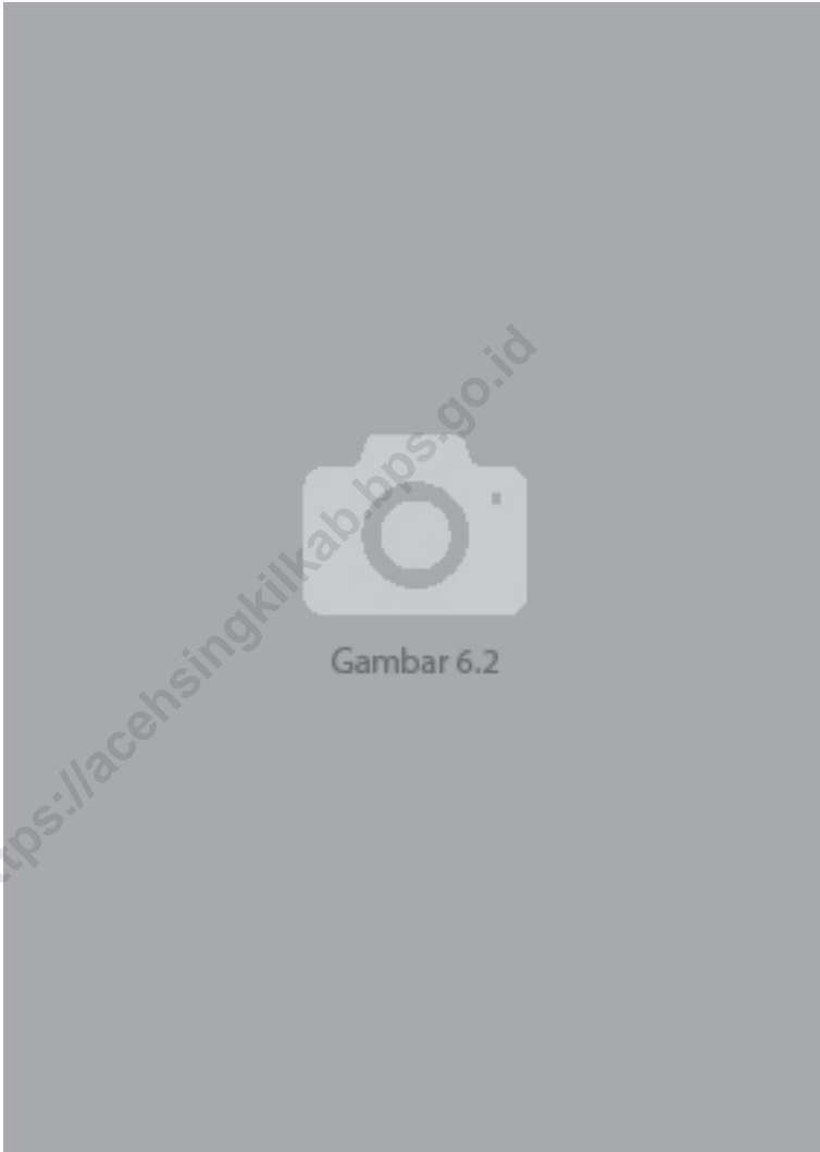
Gambar 6.2 ... Figures ...