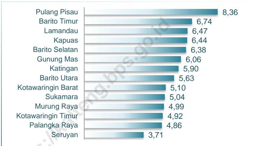
Gambar 2.1 Persentase Penduduk Lansia Menurut Kabupaten/Kota Provinsi Kalimantan Tengah, 2017