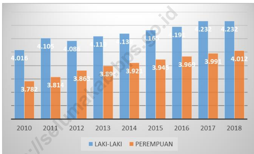
Gambar 2. Jumlah Penduduk Kecamatan Seluma Barat Tahun 2010-2018

Sumber : Proyeksi Penduduk Indonesia 2010-2035