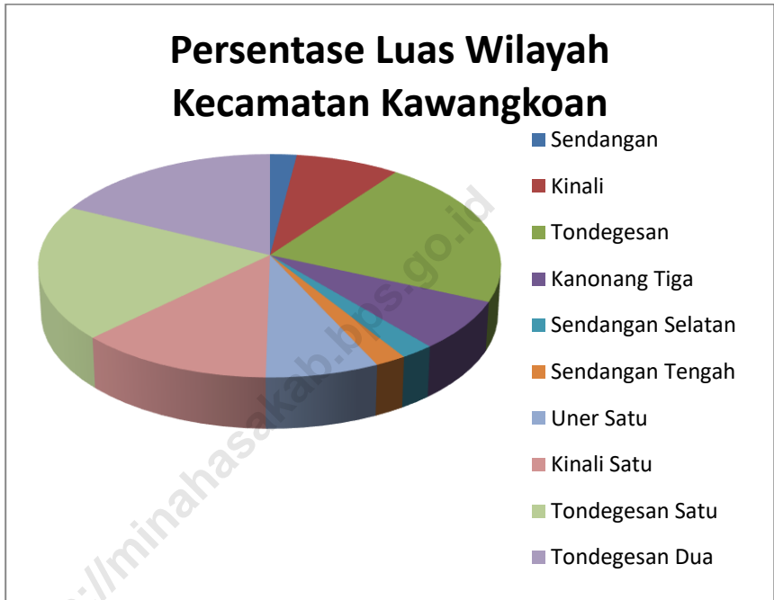
Gambar 2 Luas Wilayah Menurut Desa di Kecamatan Kawangkoan (km 2 ), 2016 Picture Total Area by Villages in Kawangkoan Subdistrict (square.km),2016