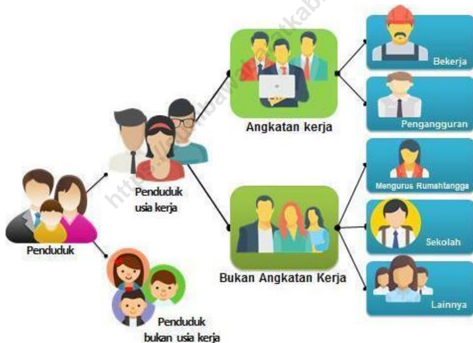
Gambar 1. Diagram Ketenagakerjaan

Konsep dan definisi yang digunakan dalam pengumpulan data ketenagakerjaan oleh Badan Pusat Statistik adalah The Labour Force Concept yang disarankan oleh International Labour Organization (ILO). Konsep ini membagi penduduk menjadi dua kelompok, yaitu penduduk usia kerja dan penduduk bukan usia kerja. Selanjutnya, penduduk usia kerja dibedakan juga menjadi dua kelompok berdasarkan kegiatan utama yang sedang dilakukannya. Kelompok tersebut adalah Angkatan Kerja dan Bukan Angkatan Kerja.