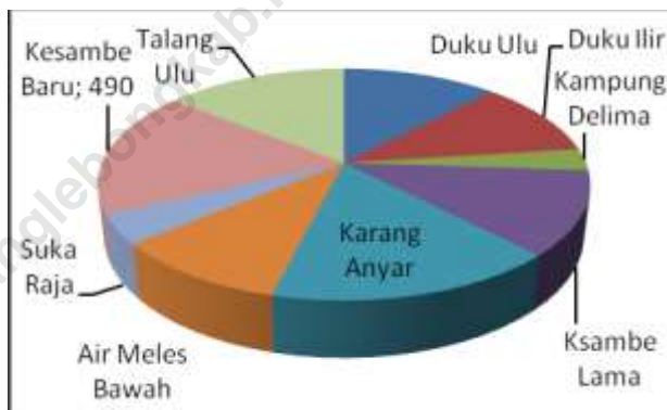
Gambaran Luas Wilayah Kec. Curup Timur Per-Desa/Kel

Luas Wilayah Kecamatan Curup Timur berdasarkan Perda Kabupaten Rejang Lebong Nomor 8 tahun 2012 tentang Rencana Tata Ruang Wilayah Kabupaten Rejang Lebong Tahun 2012-2032 Pasal 4 adalah sebesar 342 Hektar, atau 0,22% dari luas Kabupaten Rejang Lebong yang secara keseluruhan adalah 151.576 Hektar.