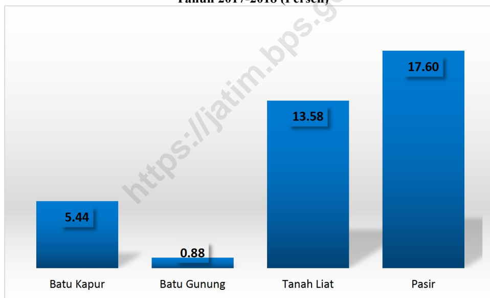
Gambar 2. Perubahan Harga Perdagangan Besar Komoditas Sektor Pertambangan Penggalian Tahun 2017-2018 (Persen)

4 (empat) komoditas sektor Pertambangan Penggalian yang diamati dalam penghitungan Indeks Harga Perdagangan Besar semuanya mengalami kenaikan harga. Komoditas Pasir mengalami kenaikan harga tertinggi mencapai sebesar 17,60 persen, sedangkan harga rata-rata komoditas Batu Gunung cenderung stabil dengan kenaikan sebesar 0,88 persen.