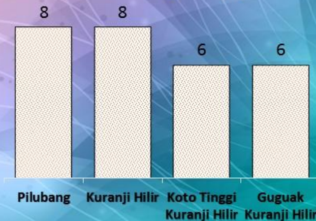
Jumlah Korong Per Nagari

JUMLAH KESELURUHAN KORONG DI WILAYAH PEMERINTAHAN KECAMATAN SUNGAI LIMAU