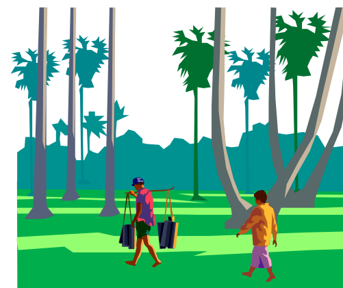
Mencari Hasil Hutan

BPS BADAN PUSAT STATISTIK KAB. PASAMAN Jl. Jend. Sudirman No. 66 Telp (0753) 20062 Lubuk Sikaping 26313