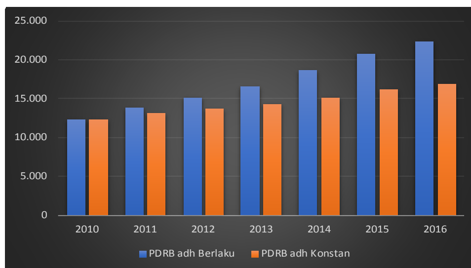
Grafik 1. Perbandingan PDRB Adh Berlaku dan Adh Konstan 2010 menurut Pengeluaran (Miliar rupiah) Tahun 2010-2016

Selama kurun waktu 2010–2016, gambaran tentang perkembangan ekonomi Kebumen berdasarkan PDRB adh Konstan dapat dilihat pada Tabel 2 di atas. Sama halnya dengan PDRB adh Berlaku, seluruh komponen pengeluaran akhir PDRB adh Konstan juga menunjukkan peningkatan dari tahun ke tahun.