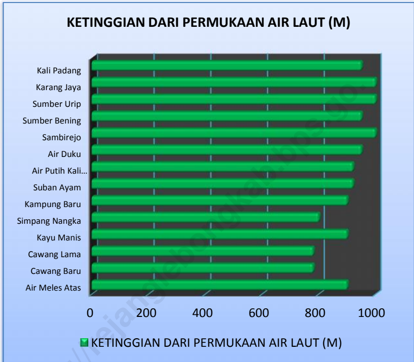
GRAFIK 1.2 : KETINGGIAN WILAYAH DARI PERMUKAAN AIR LAUT MENURUT DESA DI KECAMATAN SELUPU REJANG TAHUN 2010