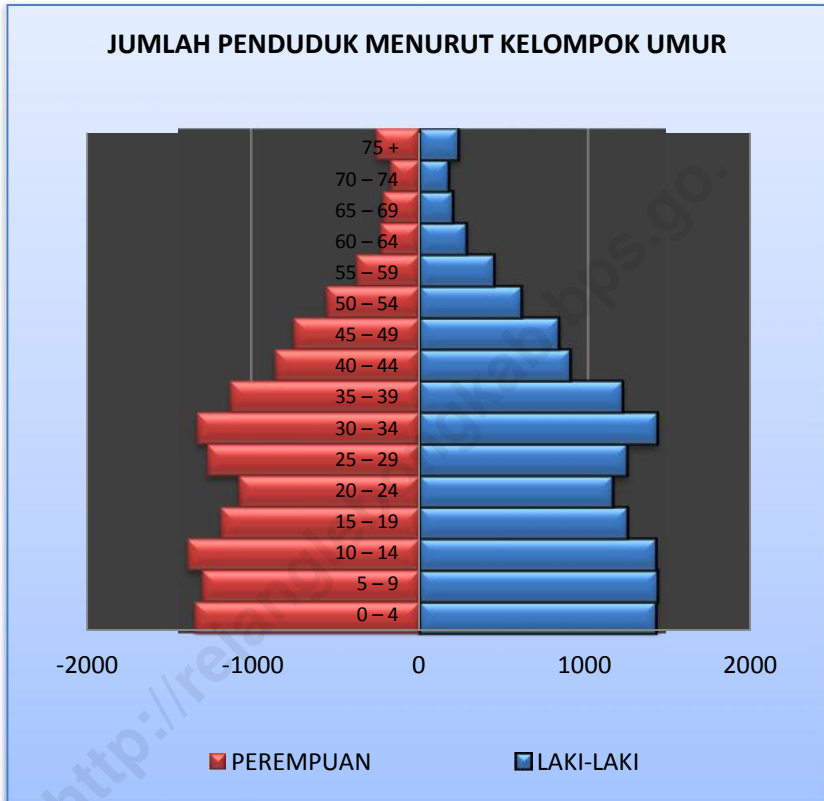
GRAFIK 3.1 : PIRAMIDA JUMLAH PENDUDUK DESA/KELURAHAN MENURUT KELOMPOK UMUR DI KECAMATAN SELUPU REJANG TAHUN 2010