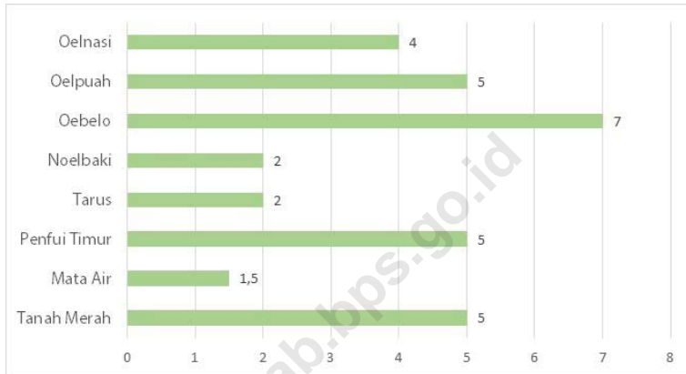
Jarak ke Ibukota Kecamatan Menurut Kelurahan/Desa di Kecamatan Kupang Tengah (Km), 2021 Distance to the Subdistrict Capital by Kelurahan/Village in Kupang Tengah Subdistrict (Km), 2021