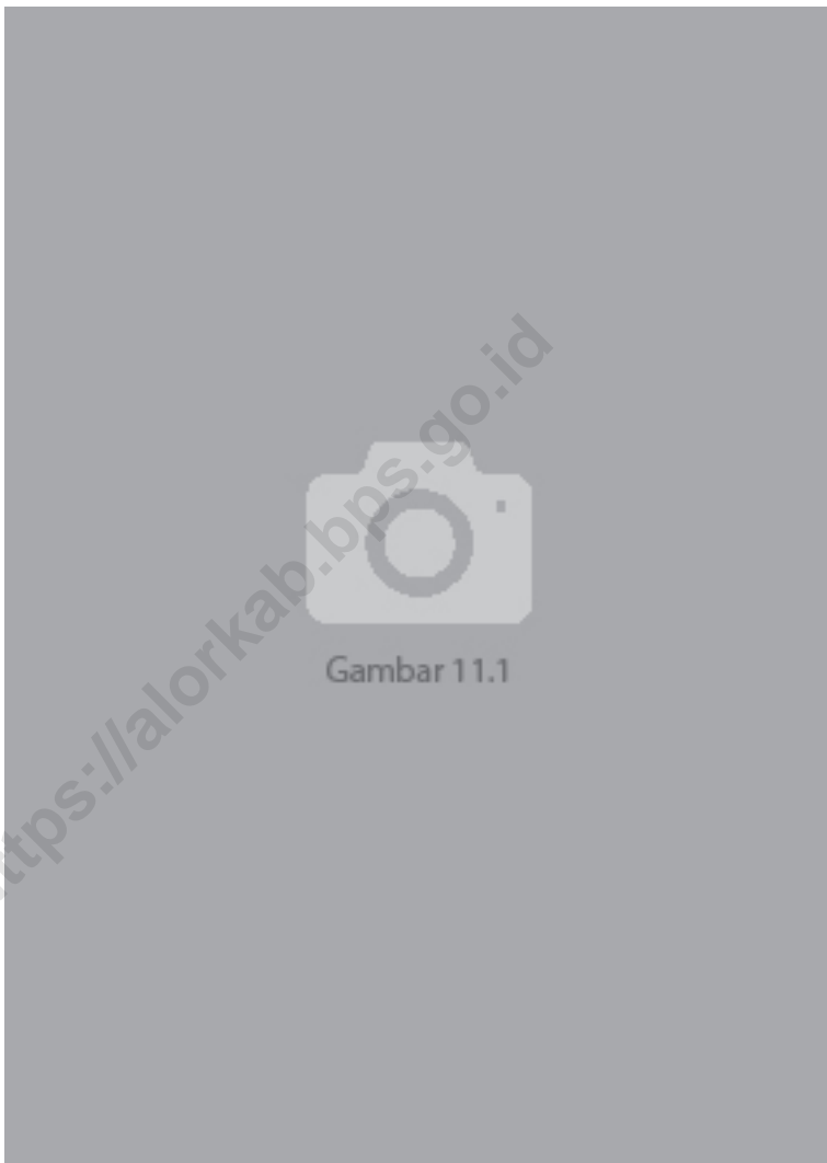
Gambar 11.1 Luas Daerah menurut Kecamatan (%), 2022 Figures Area of District (%), 2022