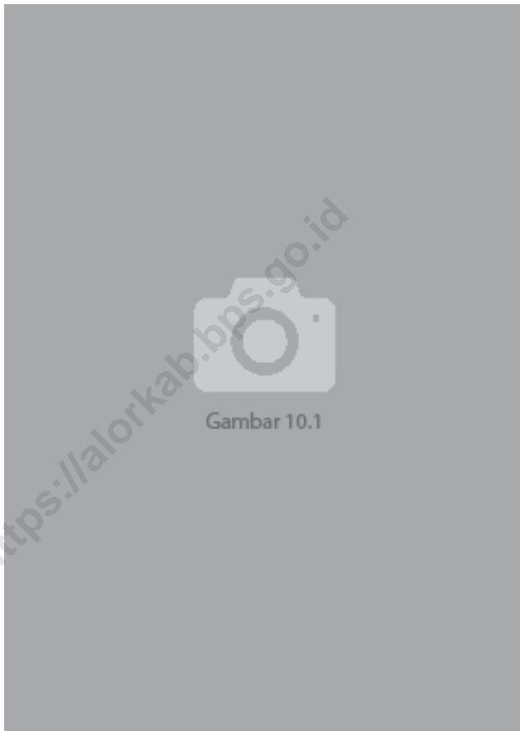
Gambar 10.1 Luas Daerah menurut Kecamatan (%), 2022 Figures Area of District (%) , 2022