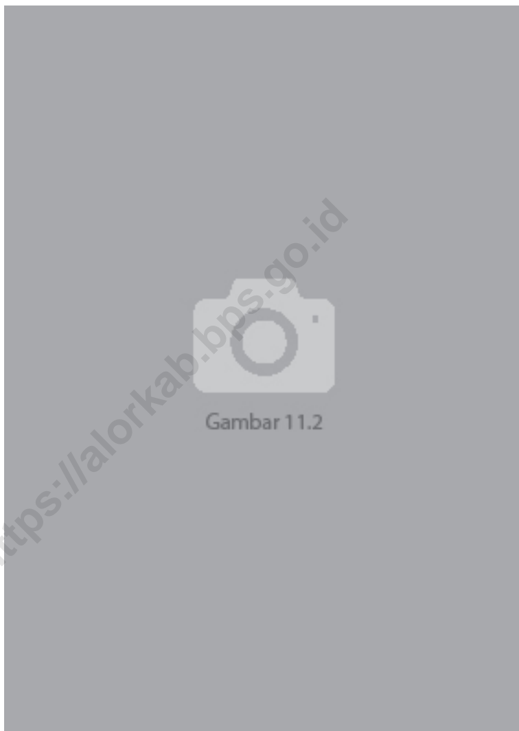
Gambar 11.2 ... Figures ...