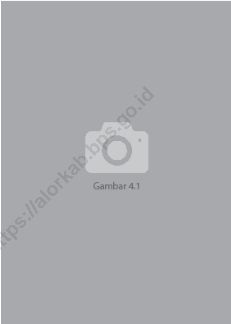
Gambar 4.1 Luas Daerah menurut Kecamatan (%), 2022 Figures Area of District (%) , 2022