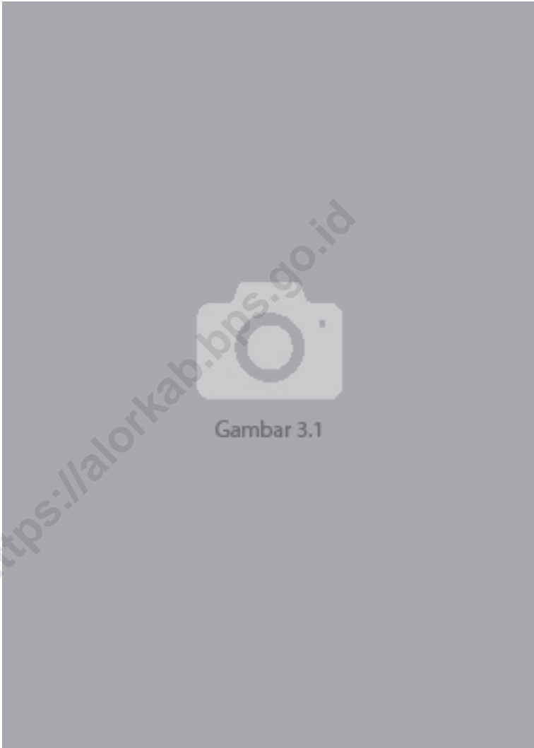
Gambar 3.1 Luas Daerah menurut Kecamatan (%), 2023 Figures Area of District (%), 2023