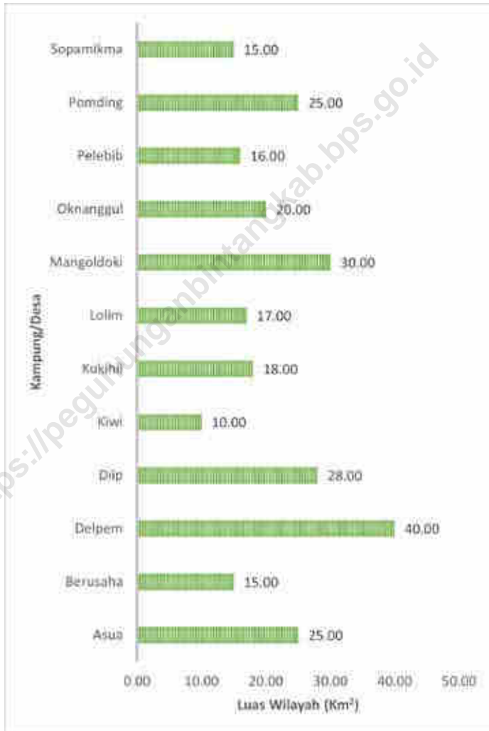
Gambar 1.1 Luas Daerah menurut Desa/Kelurahan (%), 2021 Figures Total Area by Village/Kelurahan (%), 2021