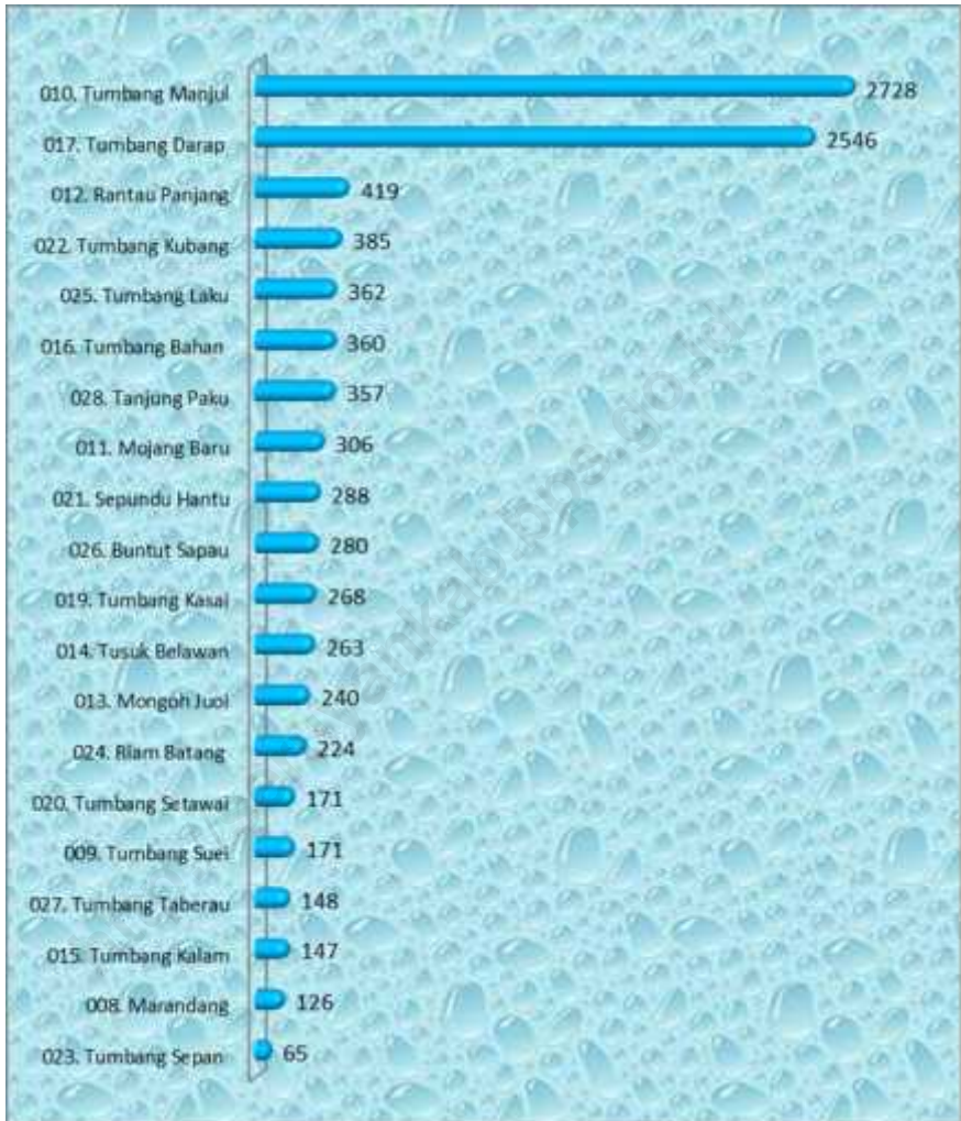
Figure 3.1 Population of Seruyan Hulu District by Village / Ward, 2012