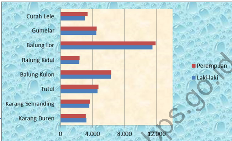
Grafik 1. Jumlah Penduduk Menurut Desa & Jenis Kelamin Tahun 2015