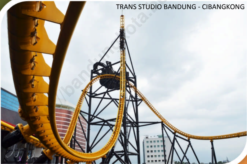
TRANS STUDIO BANDUNG - CIBANGKONG