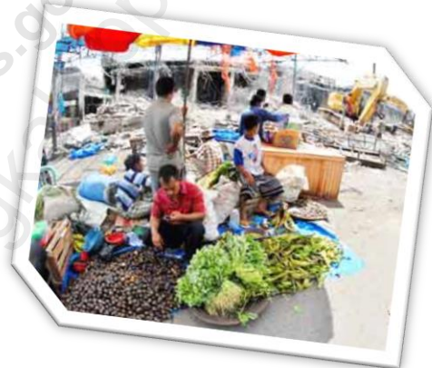
Gambar Ilustrasi Pasar

jarak tempuh ke Pasar Kab. Subang lebih dekat daripada ke pasar Kab. Sumedang. Sedangkan untuk Desa-desa yang lainnya di kecamatan Surian, masih berbelanja ke daerah Kab. Sumedang.