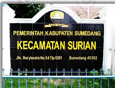
Gambar 2.1 Kantor Kecamatan Surian

Kecamatan Surian terdiri dari 9 Desa dimana setiap desa dipimpin oleh kepala desa. Kepala desa dipilih secara langsung oleh masyarakat yang tinggal di wilayah tersebut. Hal tersebut mencerminkan bahwa demokrasi sudah dilaksanakan dari sejak dahulu. Untuk mempermudah pelayanan terhadap masyarakat setiap desa dibagi menjadi beberapa Rukun Warga (RW) dan setiap RW terdiri beberapa Rukun Tetangga (RT). Kecamatan Surian memiliki 37 Rukun Warga dengan jumlah RW antara 2-8 di masing-masing Desanya.