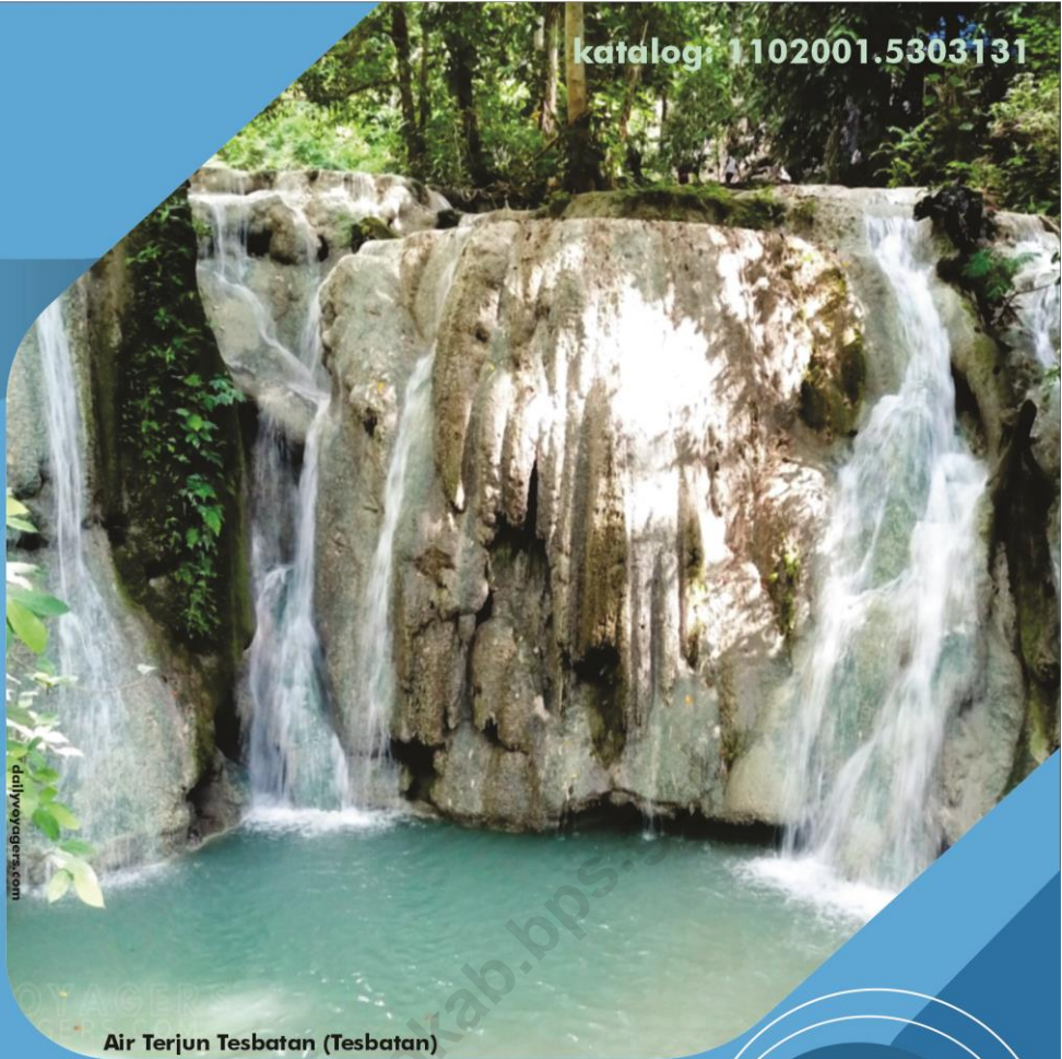
Air Terjun Tesbatan (Tesbatan)