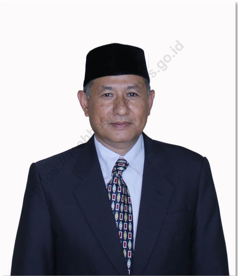
IRNANTO, ST, MM