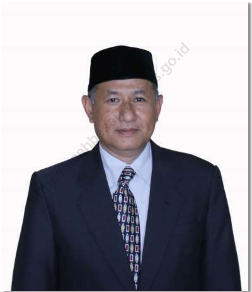
IRNANTO, ST, MM