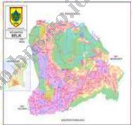
Gambar 1.2. Persentase Luas Desa kecamatan Belik 2013