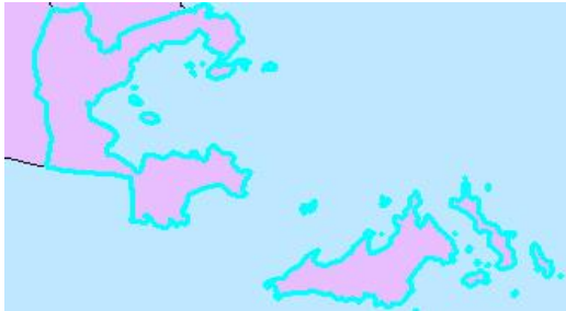
Tabel 1.1. Letak Kecamatan Punduh Pidada Menurut Batas Wilayah, 2013