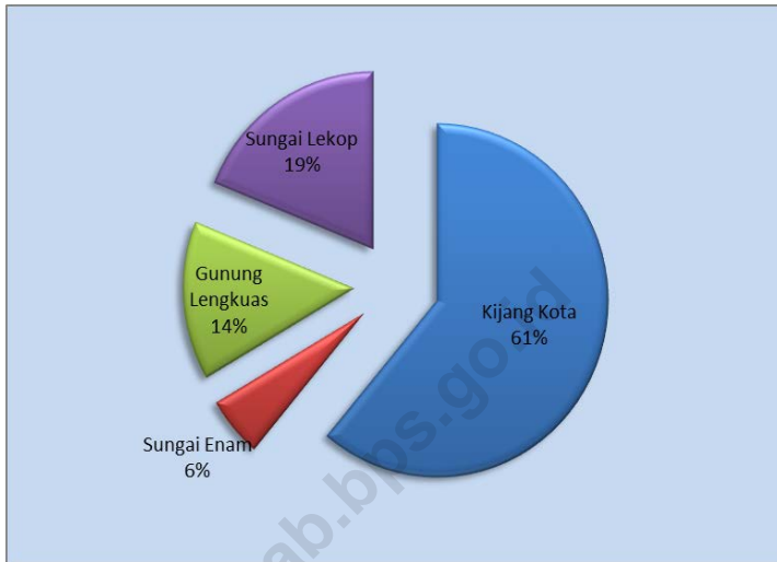
Grafik 5 : Persentase Penduduk di Kecamatan Bintang Timur 1 Januari 2018