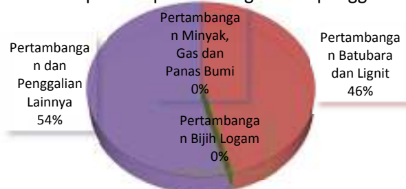
Gambar 4.1. Peranan lapangan usaha terhadap PDRB pertambangan dan penggalian (persen), 2014

Komoditas yang dominan dari lapangan usaha pertambangan adalah batubara yang tersebar di tiga kabupaten yaitu Bengkulu Utara, Bengkulu Tengah dan Seluma.