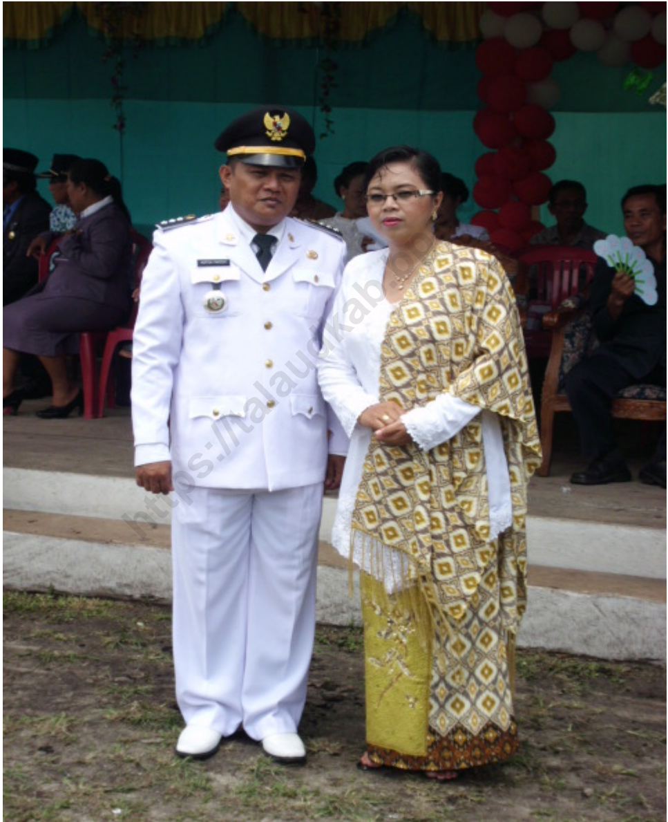
CAMAT BEO UTARA