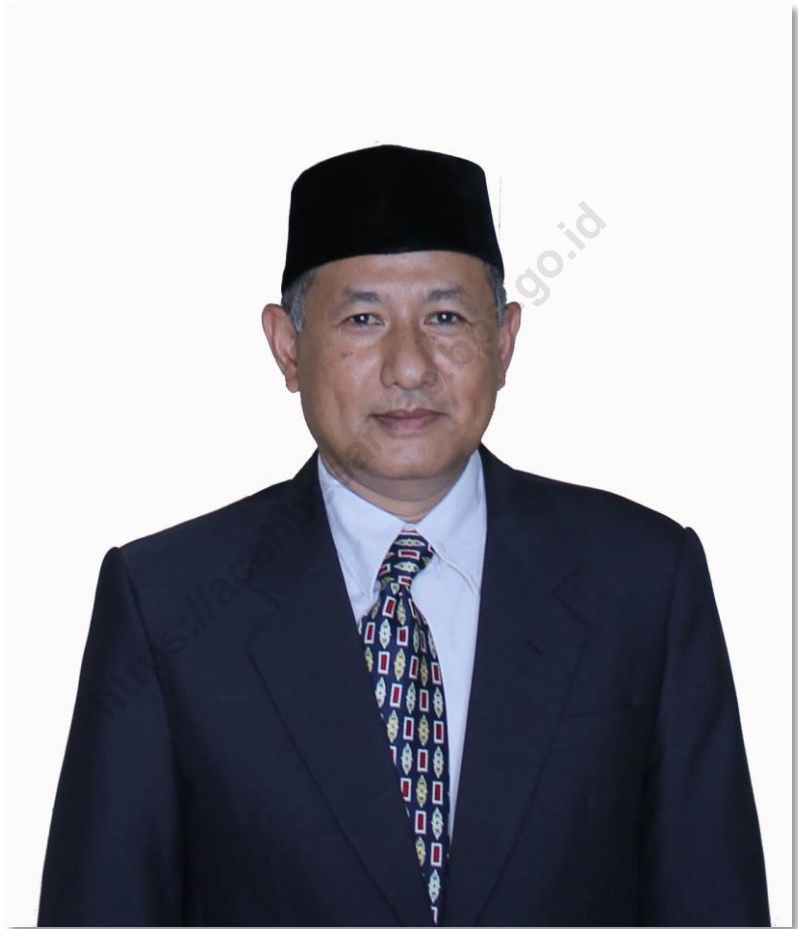
IRNANTO, ST, MM