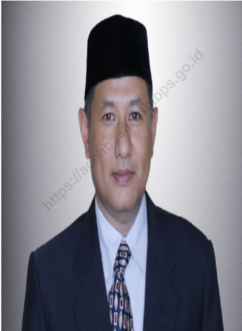
IRNANTO, ST, MM