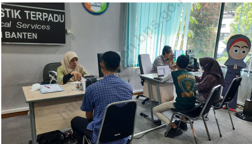
Gambar 1 Konsultasi Penyusunan MS-Kegiatan Statistik Badan Pendapatan Daerah dan Badan Kesatuan Bangsa dan Politik Provinsi Banten, Tahun 2023

Contoh kegiatan konsultasi penyusunan MS-Kegiatan Statistik sektoral oleh OPD melalui Klinik SDI dapat dilihat pada gambar berikut.