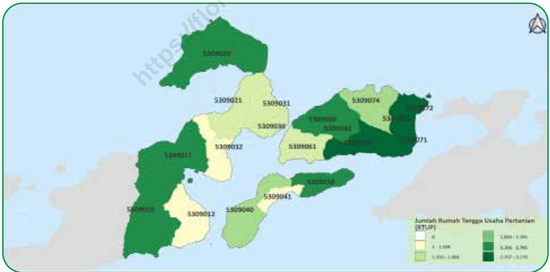
Gambar 2.4 Figures

Sebaran Usaha Pertanian Lainnya (UTL) di Flores Timur, 2023 Distribution of Other Agricultural Holding in Flores Timur 2023