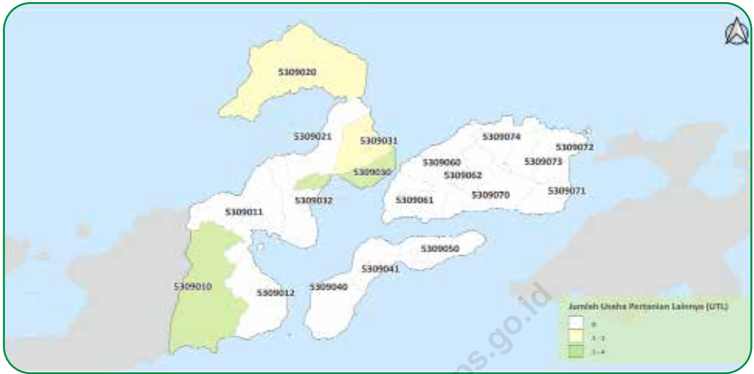
Gambar 2.3 Figures

Sebaran Usaha Pertanian Lainnya (UTL) di Flores Timur, 2023 Distribution of Other Agricultural Holding in Flores Timur 2023