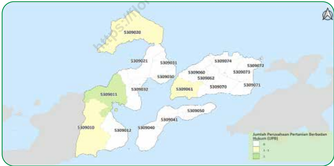
Gambar 2.2 Sebaran Perusahaan Pertanian Berbadan Hukum (UPB) di Flores Timur, 2023 Figures Distribution of Agricultural Corporation in Flores Timur, 2023