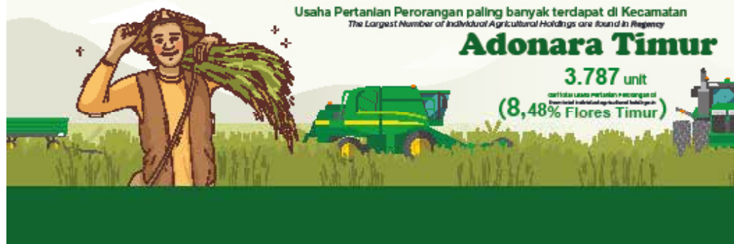
Gambar 1.2 Figures

(jumlah usaha pertanian perorangan di Kecamatan Adonara Timur)