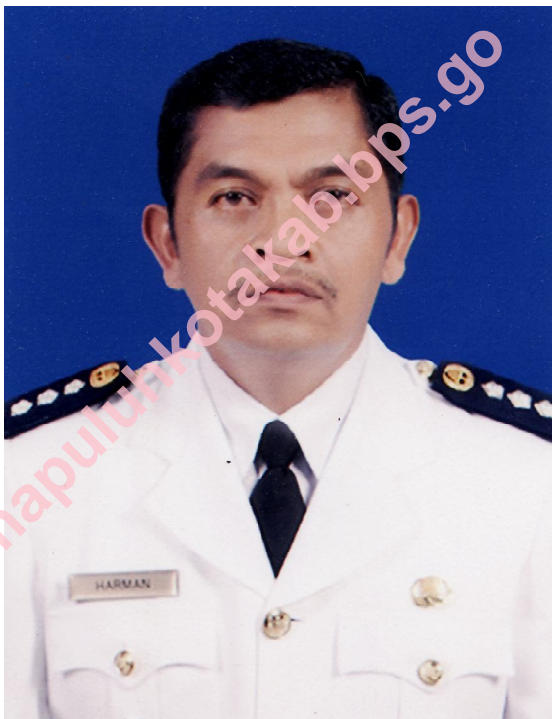
HARMAN AMd CAMAT MUNGKA