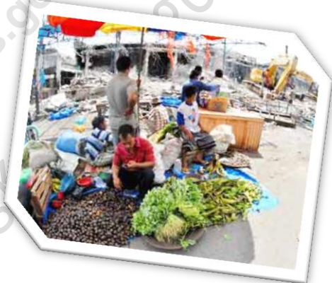
Gambar Ilustrasi Pasar

jarak tempuh ke Pasar Kab. Subang lebih dekat daripada ke pasar Kab. Sumedang. Sedangkan untuk Desa-desa yang lainnya di kecamatan Surian, masih berbelanja ke daerah Kab. Sumedang.