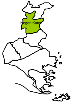
TABEL 1.1 LETAK KECAMATAN NEGERI KATON MENURUT BATAS WILAYAH TAHUN 2008