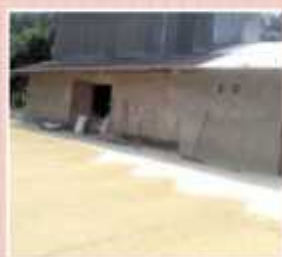
Industri Penggilingan Padi