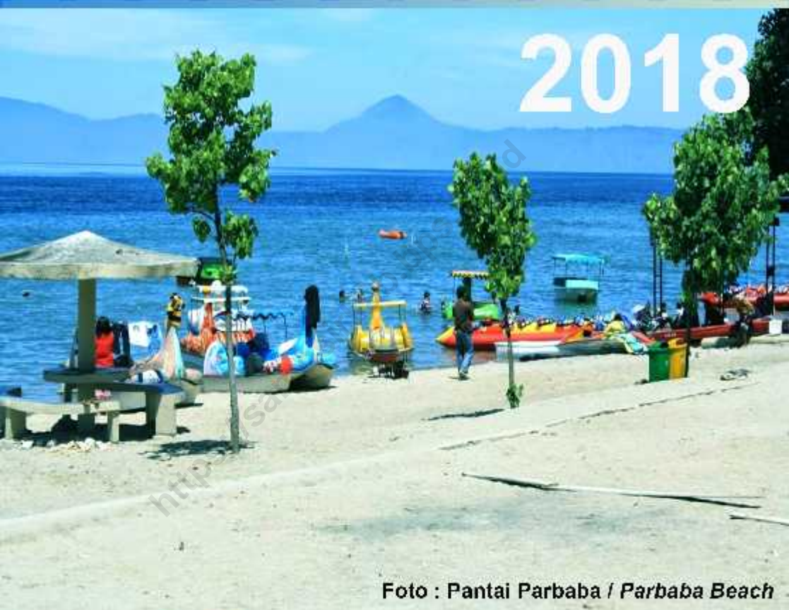
Foto : Pantai Parbaba / Parbaba Beach