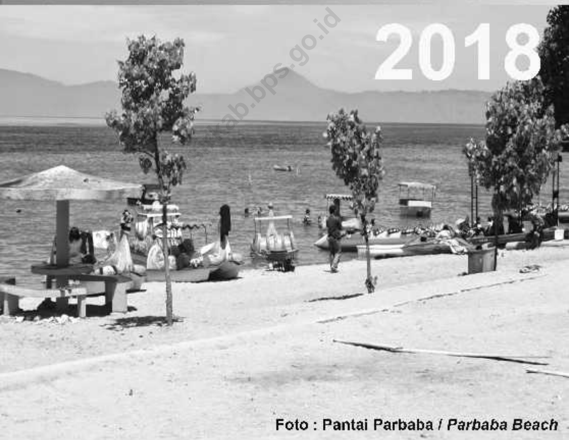
Foto : Pantai Parbaba / Parbaba Beach