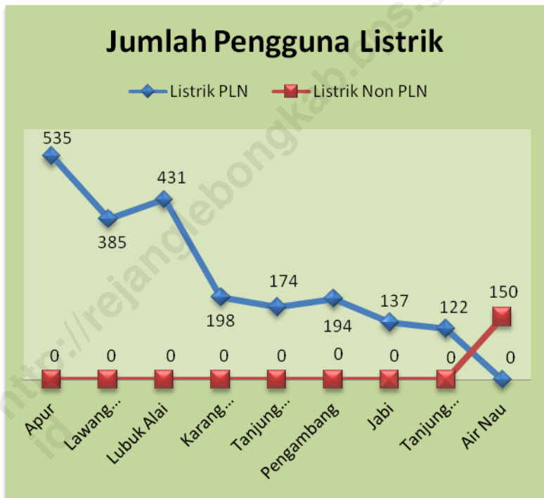
GRAFIK 6.1 : JUMLAH PENGGUNA LISTRIK MENURUT DESA / KELURAHAN DAN JENISNYA DI KECAMATAN SINDANG BELITI ULU TAHUN 2013

Sumber : Keterangan Kades di wilayah Sindang Beliti Ulu