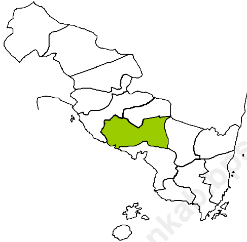
Tabel 1.1 Letak Kecamatan Sidomulyo Menurut Batas Wilayah Tahun 2009