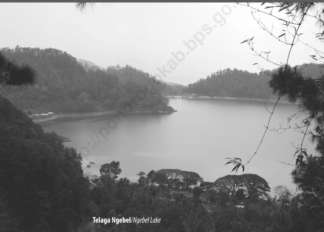
Telaga Ngebel / Ngebel Lake