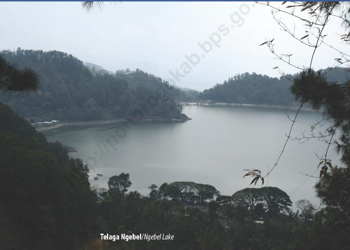
Telaga Ngebel/Ngebel Lake