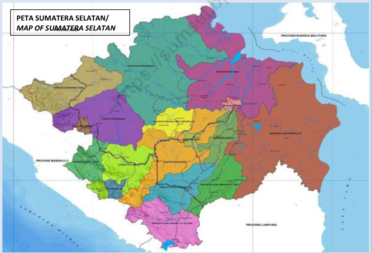
PETA SUMATERA SELATAN/ MAP OF SUMATERA SELATAN

Kabupaten : 17 Kecamatan : 232 Desa : 2.859 Kelurahan : 377