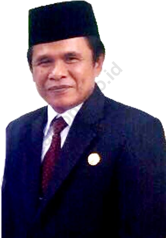
BERDIKARJAYA, SE., MM